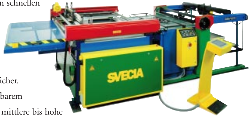
Printmaster mit optionalen, abschließbarem HTB Bogenanleger.

Die Printmaster ist "Die Maschine" für den schnellen Präzisionsdruck mit besonderer Maßgenauigkeit bei wechselnder Produktion. Das einzigartige Svecia-Printmaster System stellt einen reibungslosen, ruhigen und genauen Druck sicher. Schneller als Siebdruckmaschinen mit fahrbarem Drucktisch, ist der Printmaster perfekt für mittlere bis hohe Auflagen und liefert großartige Qualitätsergebnisse auf praktisch jedem Material. Mit dem patentierten Doppelgreifersystem, wird eine perfekte Anlage und ein glatter, ruhiger Lauf gesichert. Der Printmaster bietet mit vielen Innovationen eine hohe Flexibilität in der Standardausführung.