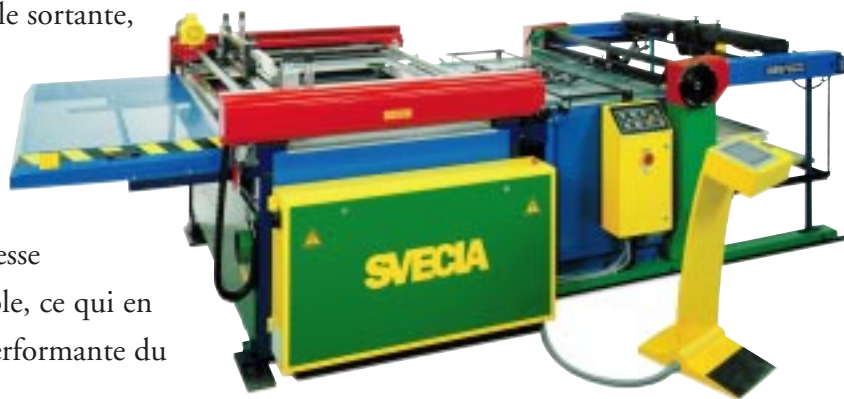
Printmaster avec le margeur HTB débrayable en option.

Dans la longue liste de ses fonctions évoluées, il faut retenir le système de deux barres de pinces breveté, qui assure un repérage parfait et un fonctionnement uniforme et silencieux. La Printmaster peut également être équipée d'une variété de systèmes et d'accessoires en option qui la rendent encore plus polyvalente, plus rapide et plus facile à utiliser.